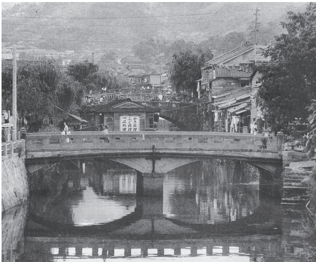
昭和 37 年当時の中島川に架かる袋橋付近の写真です。 当時、中島川には通称「かき船」と呼ばれる屋形船がありました。 写真集「長崎おもいで散歩3」(真木雄司氏撮影)より